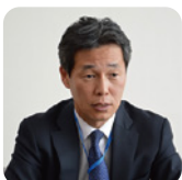
安岡 澄人氏 農林水産省 生産振興審議官