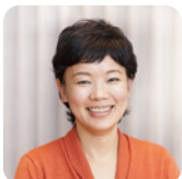
島村 菜津氏 ノンフィクション作家