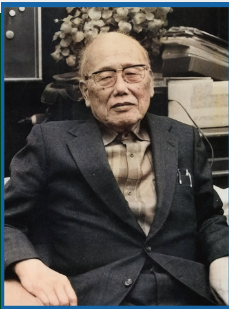
一楽照雄伝より引用

11月末まではAR体験として一楽ご子息様の声でAI一楽先生が協同組合と有機農業について語りかけます。