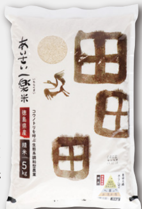
いぢらゝ一楽米 5kg イメージ

徳島県(旧：那賀郡羽ノ浦町)で産まれた一楽照雄氏は日本の有機農業、そして戦後の農業協同組合の設立にも尽力し、生産者と消費者が分断され、モノを売り買いするだけの関係に陥っている社会を克服する道として「自立と協同」を説きました。その『有機農業の父』の出生地ということから、東とくしま