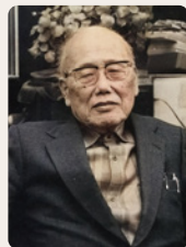
一楽照雄伝より引用

一楽照雄先生は、徳島県(旧:那賀郡羽ノ浦町)で産まれた『有機農業の父』。有機農業をはじめ、戦後の農業協同組合の設立にも尽力された人物です。